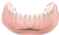
proteza na 2 implantach